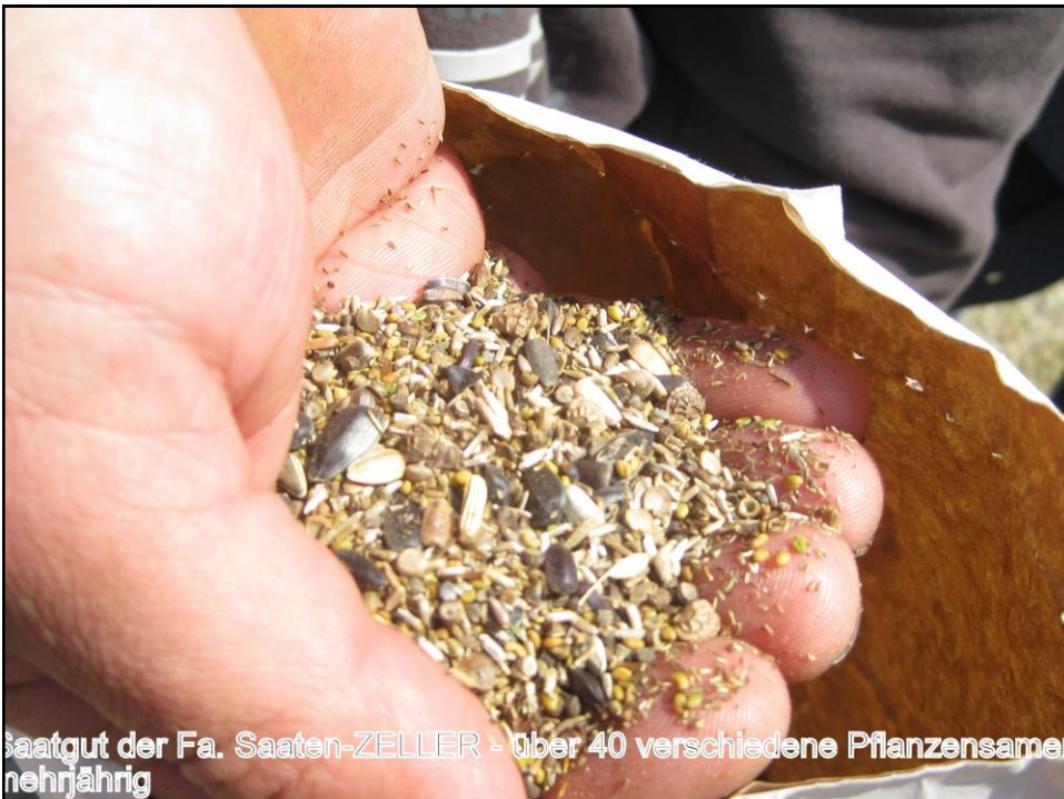
Saatgut der Fa. Saaten-ZELLER - über 40 verschiedene Pflanzensamen mehrjährig